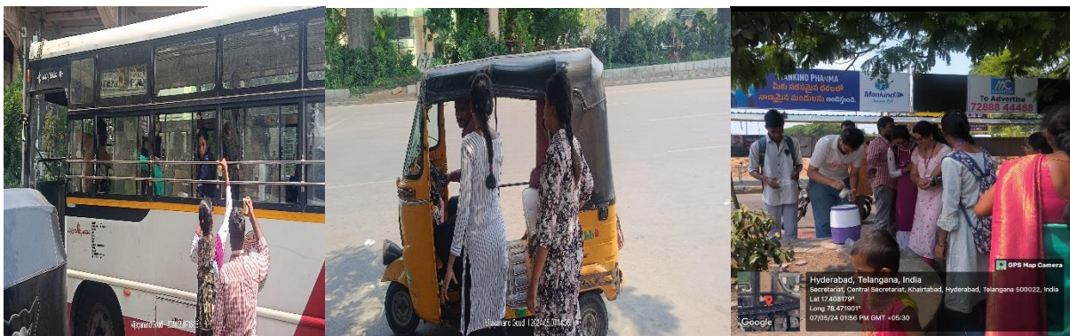
Free Distribution of Butter Milk @ Khairtabad A.G. Office Bus Stop on 08-05-2024 : NSS Unit I & II, Social Responsibility Committee and Eco Club & NCC Unit Organised Free Distribution of Butter Milk at A.G. Office Bus Stop for Bus Drivers, Conductors, passengers and out Siders. SR & Eco Club Convenor, NSS Programme Officers, Faculty Members, SR & Eco Club Volunteers & NSS Volunteers participated in the programme.