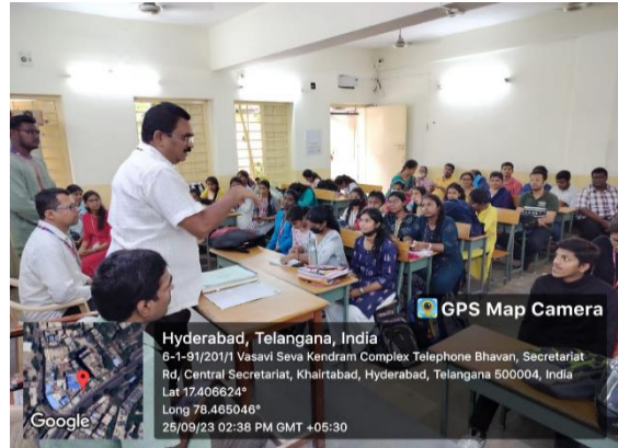
15. Vinayaka Nimajjanam Prasada Vitarana, 28 th September, 2023 :15 NSS volunteers participated in the Vinayaka Nimajjanam Prasada Vitarana jointly organised by Vasavi Seva Kendram, Hyderabad and IIMC.