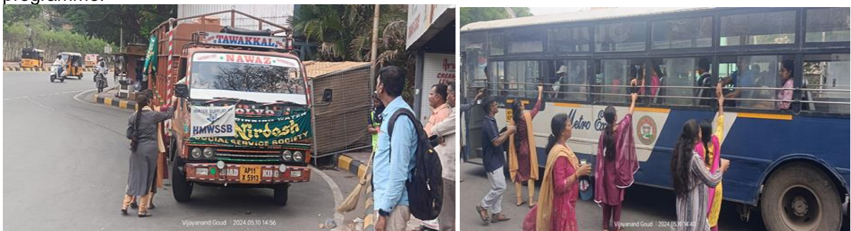
40. Parliament Elections 2024 PWD & Senior citizens Volunteer Service on 13/05/2024: 27 Volunteers served as NSS Volunteers in accessible election for Person with Disabled and Senior