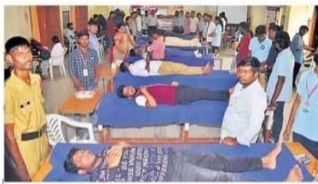
రక్తదానం: బైరతాబాద్లోని ఐఐఎంసీ కళాశాలలో ఆన్ క్యాంప్ అండ్ డోనేషన్ కళాశాల, ఎన్ఎస్సీఎస్సీ, వానపీ క్లబ్ సంయుక్తంగా నిర్వహించారు. ఇన్స్టిట్యూట్ ఆఫ్ ప్రీవెంటివ్ మెడిసిన్ డాక్టర్లు శాశిరత్, డీఎన్ నేతృత్వంలో కళాశాల విద్యార్థులు, కుటుంబ సభ్యులు సుమరి 83 యూనిట్ల రక్తాన్ని సేకరించినట్లు తెలిపారు. ఇప్పటివరకు 51 సార్లు రక్తదానం చేసినట్లు తెలిపారు. రక్తదాన ప్రాజాక్టును నిర్వహించడంలో ఉన్న వారికి అధ్యక్షులు మోగా రక్తదాన శిబిరాన్ని నిర్వహించాయని ప్రెస్విడెంట్ గుర్తు చేశారు. ఆసంకరం రక్తదానం చేసే వారికి ప్రత్యేక పత్రాలను పంపిస్తారు. - బైరతాబాద్, సెప్టెంబర్ 13

14/09/2023 | Hyderabad(Khairatabad) | Page : 9