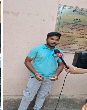
39. Free Distribution of Buttermilk on 04/05/2024 to 10/05/2024 @ Khairatabad: Free Distribution of Buttermilk organized jointly by NSS Unit 1&2 and Social Responsibility Committee & ECO Club in Various places in khairatabad.