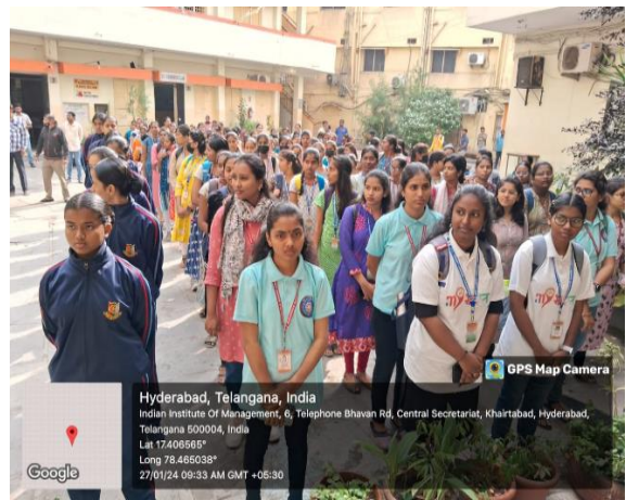
28. Martyr's Day celebrations on 30 th Jan,2024: Martyr's Day (Gandhiji Death Anniversary) observed by NSS Unit I & II. One-minute silence was observed in the college assembly by staff, students and volunteers.