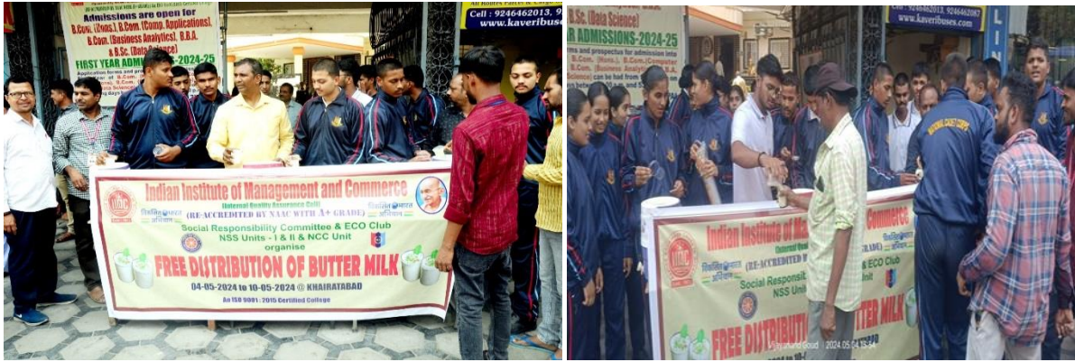
Free Distribution of Butter Milk @ Khairtabad BSNL Bus Stop on 06-05-2024: NSS Unit I & II, Social Responsibility Committee and Eco Club and NCC Unit Organised Free Distribution of Butter Milk at BSNL Bus Stop for Bus Drivers, Conductors, passengers and out Siders. SR & Eco Club Convenor, NSS Programme Officers, SR & Eco Club Volunteers & NSS Volunteers participated in the programme.