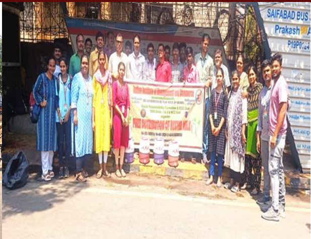
Free Distribution of Butter Milk @ Khairatabad IIMC Premises on 04-05-2024: NSS Unit I & II, Social Responsibility Committee and Eco Club and NCC Unit Organised Free Distribution of Butter Milk at IIMC Premises. Vice Principal, SR & Eco Club Convener, NSS Programme Officers, NCC Officer, SR & Eco Club Volunteers, NSS Volunteers & NCC Cadets Participated in the Programme.