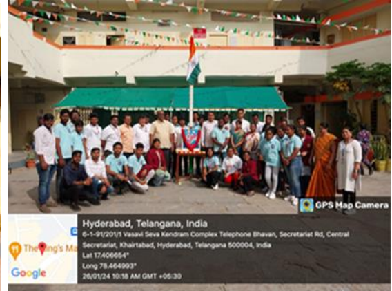
27. National voter's pledge on 27 th Jan, 2024: National Voter's Day pledge organised in the College Assembly. 200 students, Principal, Programme officers, staff, students and volunteers were participated in the programme.