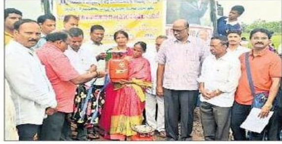
గ్యాస్స్టా అందజేస్తున్న నాయకులు

ఏటూరునాగారం: కొండాయి వరద బాధితులకు హైదరాబాద్ ఆర్యవైశ్య మహాసభ, ఇండియన్ ఇన్స్టిట్యూట్ ఆఫ్ మేనేజ్మెంట్ కామర్స్ ద్వారా జోత్యిర్ధింగా ఆర్యవైశ్య నిత్యాన్నదాన సత్రం ట్రస్ట్ ద్వారా గురువారం 180 మందికి గ్యాస్స్టావలను పంపిణీ చేశారు. ఈ కార్యక్రమంలో జెడ్పి సీఈఓ