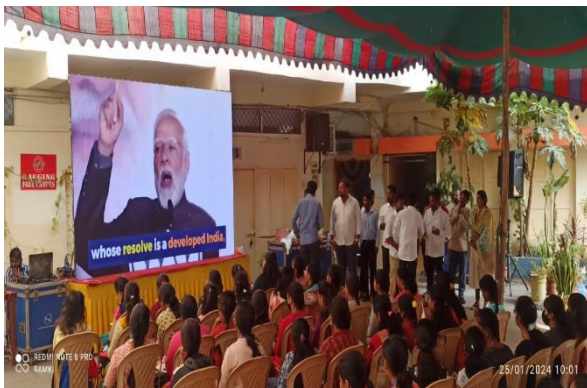
25. Namo Navmatdata Sammelan on 25 th Jan,2024: Namo Navmatdata sammelan organised for first time voters in IIMC premises. 600 students were participated in the programme.