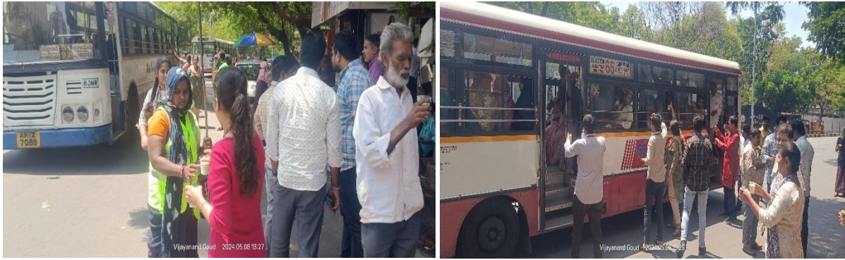
Free Distribution of Butter Milk @ Khairtabad Lakdikapul Bus Stop on 09-05-2024: NSS Unit I & II, Social Responsibility Committee and Eco Club and NCC Unit Organised Free Distribution of Butter Milk at Lakdikapul Bus Stop for Bus Drivers, Conductors, & passengers. SR & Eco Club Convenor, NSS Programme Officers, Faculty Members, SR & Eco Club Volunteers & NSS Volunteers participated in the programme.