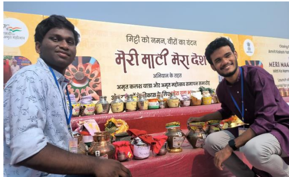
22. Rastriya Ekta Diwas (National Unity Day), 31 st October, 2023: 1000 members including NSS volunteers, Programme officers, students and staff were participated in the Rastriya Ekta Pledge organised in the college assembly for the Rashtriya Ekta Diwas.