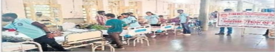
ఎంఎస్సెస్ కేన్సర్ ఆసుపత్రిలో రోగులకు పండ్లు పంపిణీ చేస్తున్న ఎన్ఎస్సెస్ విద్యార్థులు

04/02/2024 | Hyderabad | Page : 9