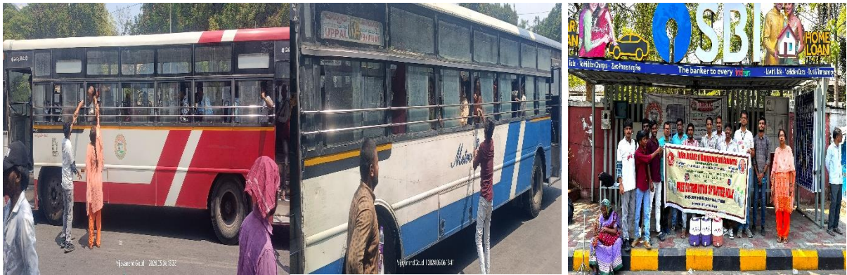
Free Distribution of Butter Milk @ Khairtabad Secretariat Bus Stop on 07-05-2024 : NSS Unit I & II, Social Responsibility Committee and Eco Club and NCC Unit Organised Free Distribution of Butter Milk at Secretariat Bus Stop for Bus Drivers, Conductors, passengers and out siders. SR & Eco Club Convenor, NSS Programme Officers, SR & Eco Club Volunteers & NSS Volunteers participated in the programme.